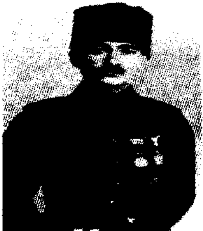
KUT'UL AMARE KAHRAMANI HALİL KUT

1952 yılına kadar Kut Bayramı olarak kutlanan Kut-ül Amare Muharebesi, 1. Dünya Savaşı'nın en önemli muharebelerinden biri olarak biliniyor. Osmanlı Ordusu, Kut-ül Amare Muharebesi ile Çanakkale'den sonra İngiliz birliklerine karşı ikinci büyük darbeyi vurdu. Kut-ül Amare, Dicle Nehri kıyısında Şattülarap Kanalı ile birleşen Basra Körfezi'nin kuzeyi ile Bağdat'ın güneyinde bulunan bir kasaba... Adını kasabadan alan muharebe, şehrin yakınlarında konuşlanmış İngiliz birlikleri ile müttefiklerinin kuşatılmasıyla başladı. Kasabanın Osmanlı Ordusu tarafından ele geçirilmesi ve 13 bin İngiliz askerinin tamamının esir alınmasıyla da bitti.